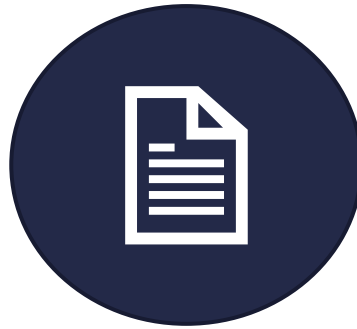
Standardisering av intygsinformation