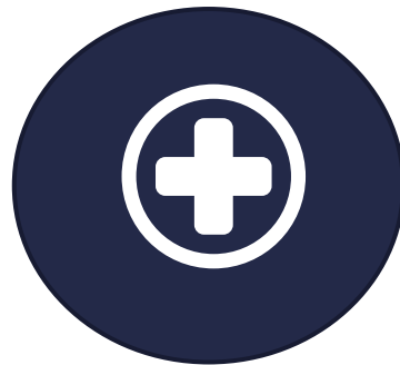
UMI och viktig medicinsk information