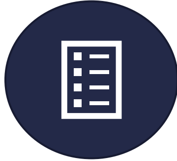
Kodverk för verksamhetsinriktad och vårdtjänster H & S