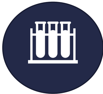
Medicintekniska produkter enligt EHDS