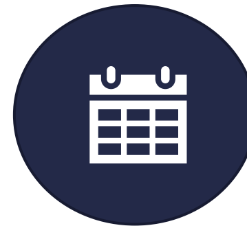
Nationell anpassning av IDMP-standarden