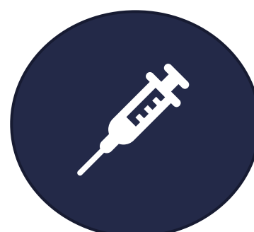
Läkemedelsbehandling/information enligt EHDS