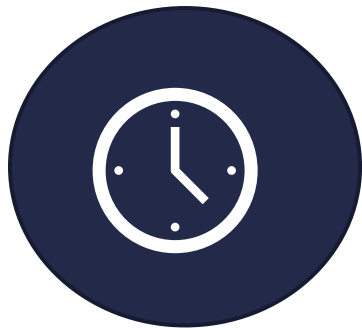
Vårdförmedling - väntetider samt problem, diagnos och åtgärd